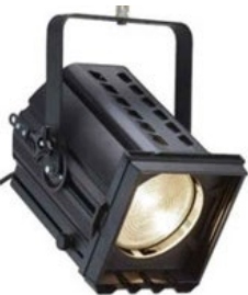
Selecon-Arena Theatre Fresnel 200 мм