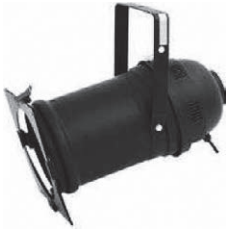
EuroLite-PAR-64 Profi Spot