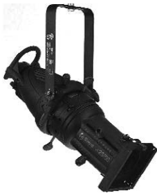
Strand Lighting-SL 23/50

Использование нашего экрана невозможно при банкетной рассадке.