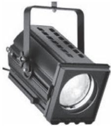
Selecon-Arena PC 200 мм