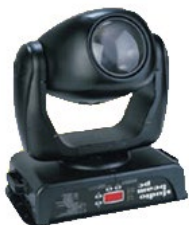
High End-Studio beam