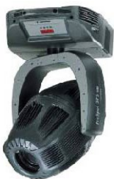
Coemar-ProSpot 575 MB