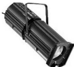
Selecon-Arena Zoomspot Wide 20-37