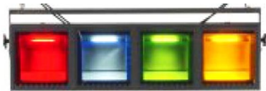
Selecon-Aurora Cys 4 Linear