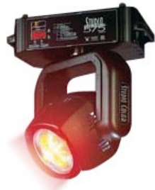
High End-Studio color 575